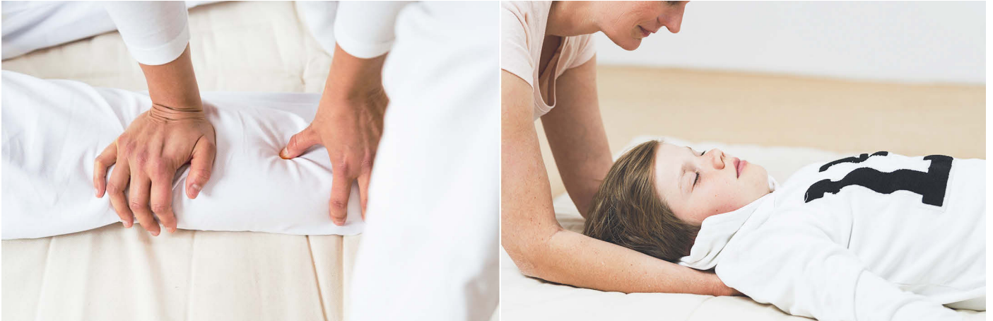
Abb. 3: links: Achtsame, in die Tiefe gerichtete Berührungen sind ein Wesensmerkmal von Shiatsu. Rechts: Shiatsu eignet sich für Menschen jeden Alters und ist auch für Kinder eine wunderbare Methode zur Prävention.

untersucht, ob Shiatsu mit seiner besonderen Berührungskunst einen Einfluss auf die Stressverarbeitung hat. Dies wurde durch das Messen des Neurotransmitters OT im Speichel und durch den Fragebogen Burnout-Screening-Skala II (BOSS II) untersucht. Die Ergebnisse zeigten einen Anstieg der Werte um elf Prozent nach nur fünf Behandlungen und somit einen positiven Einfluss von Shiatsu auf die Stressempfindung [7].