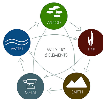
Abb. 2: Im Rahmen der Fünf-Elemente-Lehre bzw. Wandlungsphasen (wu xing) wird das Herz dem Feuerelement zugeordnet.

Betrachten wir das Ganze am Beispiel von Kortisol. Kortisol zählt, wie die Katecholamine Adrenalin und Noradrenalin, zu den Stresshormonen, deren Sekretion unter Stress ansteigt. Oxytocin (OT) hingegen, ein im Gehirn produziertes Hormon, verringert u. a. den Kortisolspiegel. In einer kleinen Pilotstudie aus dem Jahr 2018 wurde